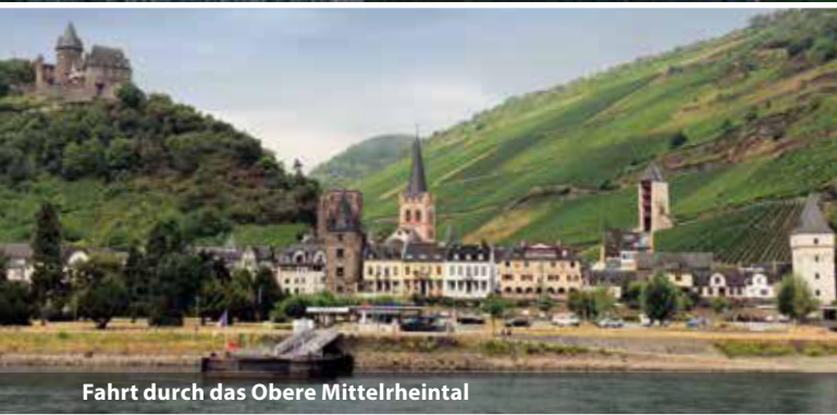
Fahrt durch das Obere Mittelrheintal